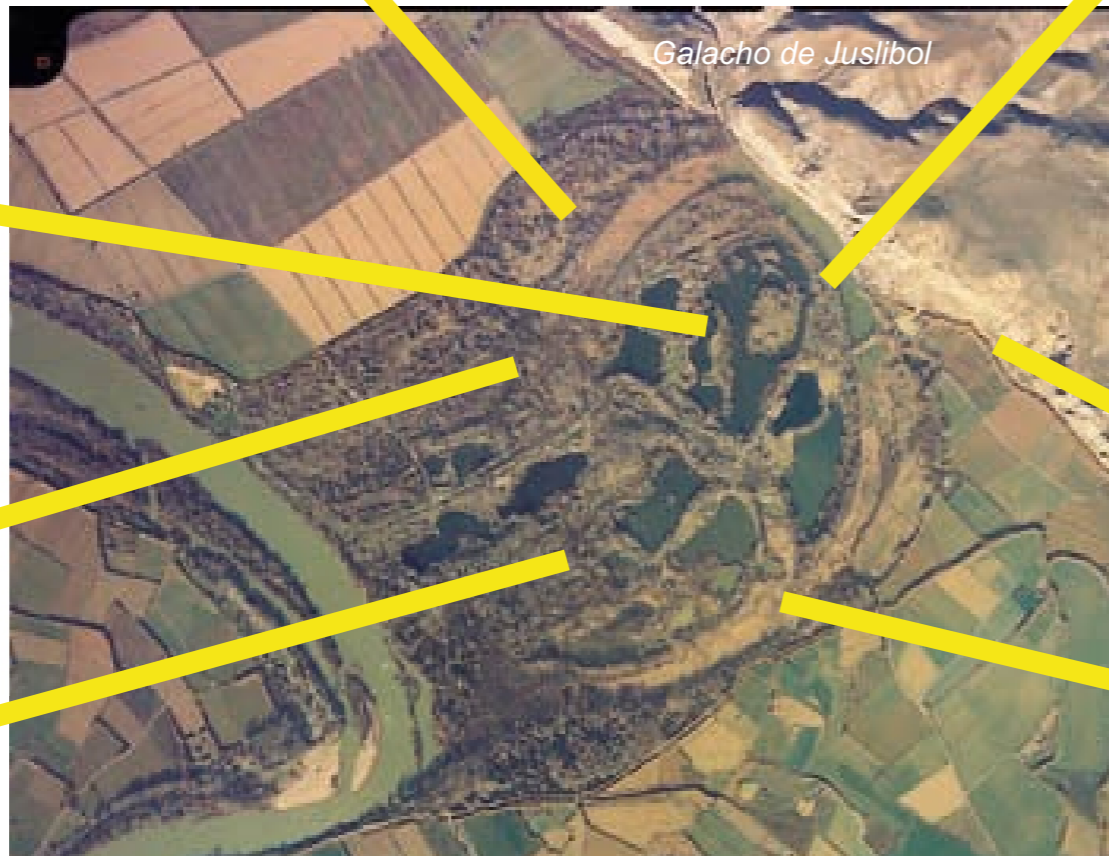
Galacho de Juslibol